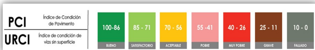
Escala de clasificación PCI/URCI empleada a partir del año 2021